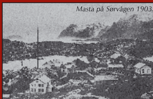
Masta på Sørvågen 1903.

Web: www.lofoten-info.no/telemuseum/ Postadresse: 8392 Sørvågen, Lofoten Telefon: 76 09 14 88