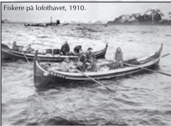
Fiskere på lofohavet, 1910.