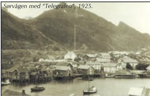
Sørvågen med "Telegraf", 1925.