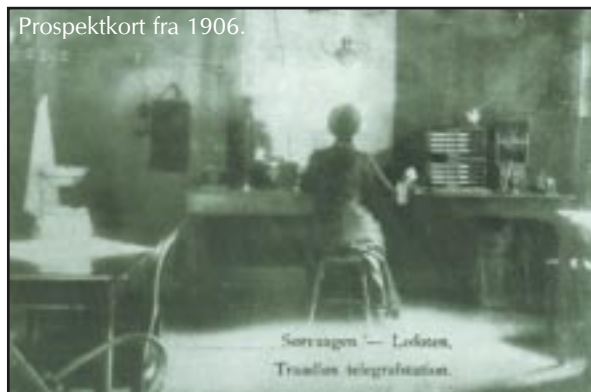
Prospektkort fra 1906.

Lofoten og landet for øvrig. Prøvene i 1903 gikk over all forventning, og den 1. mai 1906 kunne den trådløse forbindelsen med Telefunken-apparatur fra Sørvågen til Røst åpnes - Nord-Europas første sivile radiotelegraf (gnisttelegraf). Italienerne fikk sin året før, men Sørvågen kom i alle fall som nummer to på verdensstatistikken.