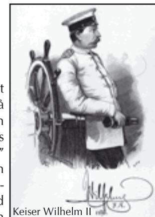
Keiser Wilhelm II

I 1906 og 1907 satset "telegrafens" betjening på Sørvågen alt for å yte den tyske keiser Wilhelms skip "Hohenzollern" den beste service, men forgjeves. Sørvågen oppnådde ikke kontakt med keiseren. Dette var en skam for det unge Norge. Men, den 1. juli 1908 fikk de omsider kontakt. Vi kan nok takke keiseren for at telegrafen på Sørvågen ble åpnet for kontakt med skip i sjøen, som den første i sitt slag i Norge.