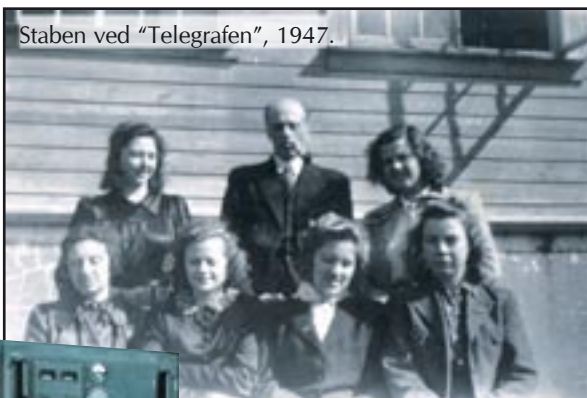
Staben ved "Telegraf", 1947.

Tyskerne hadde under krigen også utviklet "bredbånd" - radioforbindelse (for desimeterbølger) - som gav rask og sikker sending. Det norske Telegrafverket overtok en del av det tyske Telefunken-utstyret (desimetersett) og etablerte i 1946 Norges første sivile radiolinje, mellom Sørvågen-Værøy og Sørvågen-Røst.