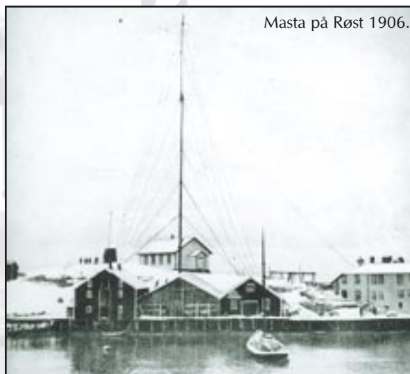
Masta på Røst 1906.

Lofoten og landet for øvrig. Prøvene i 1903 gikk over all forventning, og den 1. mai 1906 kunne den trådløse forbindelsen med Telefunken-apparatur fra Sørvågen til Røst åpnes - Nord-Europas første sivile radiotelegraf (gnisttelegraf). Italienerne fikk sin året før, men Sørvågen kom i alle fall som nummer to på verdensstatistikken.