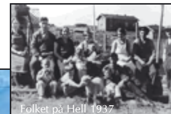
Folket på Hell 1937

Televerket skaffet seg de første apparater for trådløs telefoni (radiotelefoni) i 1919. Linjetelefonen fikk nå en konkurrent - slik linjetelegrafen hadde fått da radiotelegrafen (trådløs telegraf) kom. Norges første radiotelefonistasjon ble også lagt i tilknytning til Sørvågen radio. Lofotodden radiotelefonistasjon på Hell korresponderte med Sørvågen fra 1928. Noen få år etter fikk Værøy liknende samband med Sørvågen.