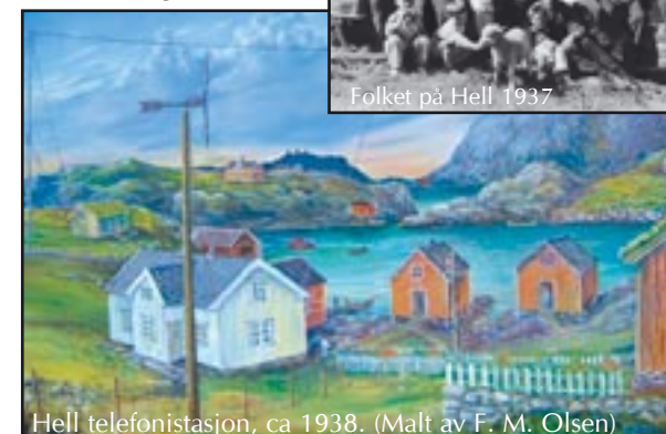
Hell telefonistasjon, ca 1938. (Malt av F. M. Olsen)