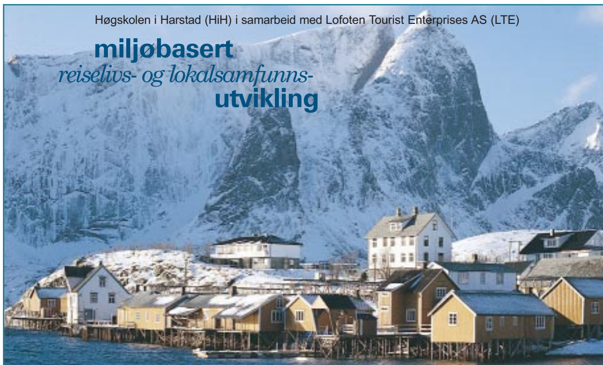
Bildet viser Sakrisøy ved Reine i Moskenes kommune, Lofoten.

Studiested: Sørvågen, Moskenes i Lofoten. Fylldig informasjon om studiet og studiestedet finnes på: